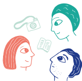
La construction d'un projet social et ou professionnel