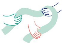
L'entraînement des compétences sociales