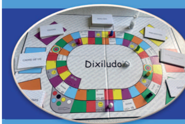
Jeu Dixiludo et Atelier Théâtre