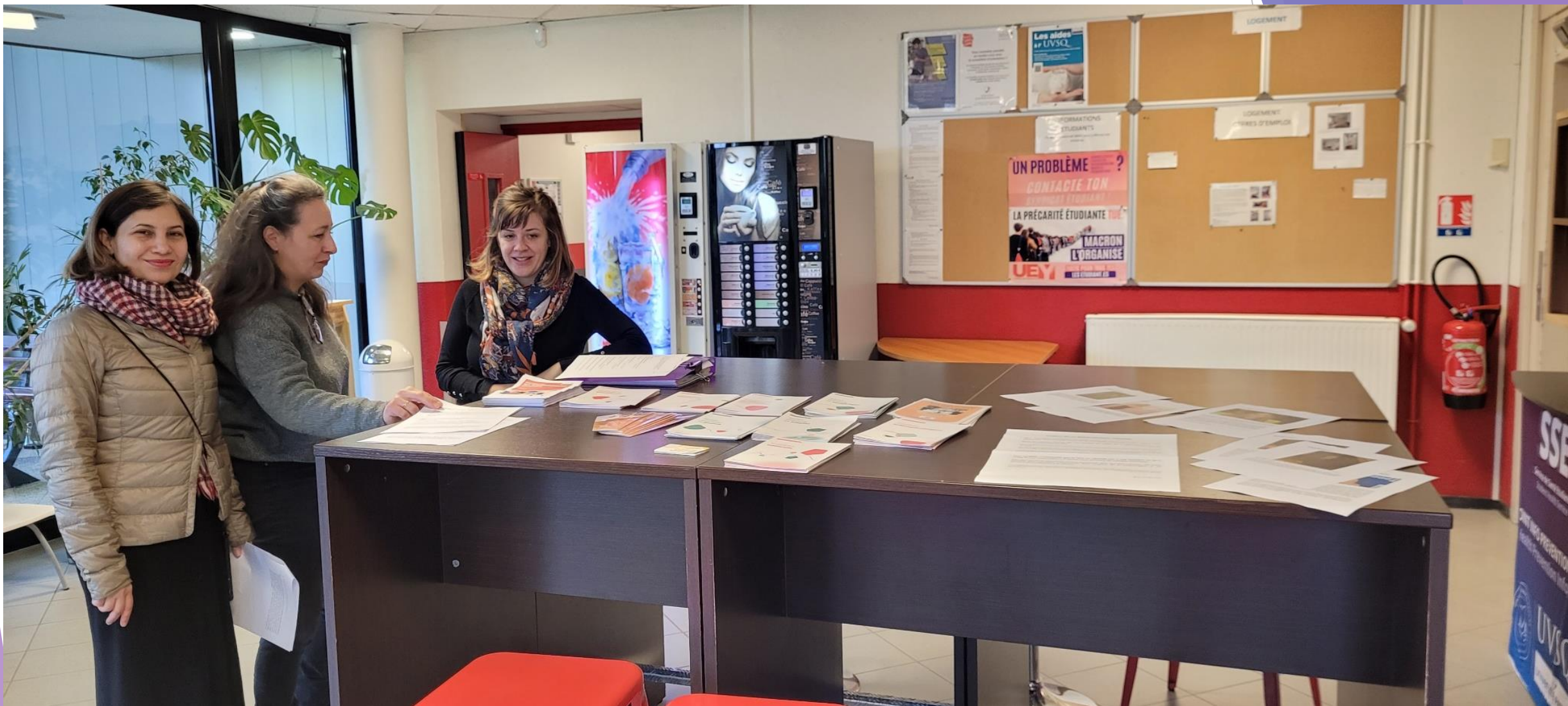
BV IUT de Rambouillet Février 2025